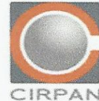
Círculo de Empresas Panam Norte CIRPAN